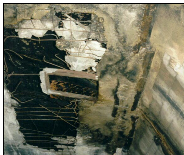
POŠKOZENÝ MEZISTROP VĚTRACÍHO KANÁLU