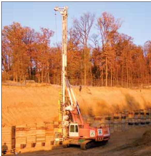
Obr. 3 Beranění zápor zajištění stavební jámy v prostoru komořanského portálu Fig. 3 Driving soldier beams supporting the construction trench at the Komořany portal