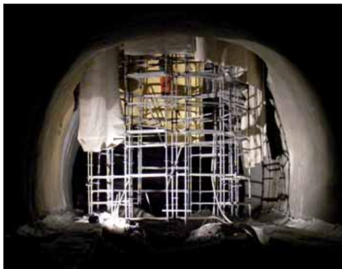
Obr. 10 Izolační práce ve vzduchotechnické šachtě Fig. 10 Installation of waterproofing in the ventilation shaft