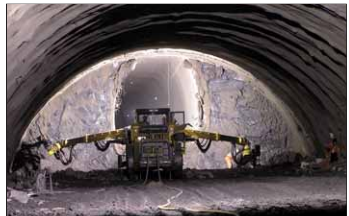
Obr. 4 Vrtání čelby třípruhového tunelu Fig. 4 Drilling into the triple-lane tunnel excavation face