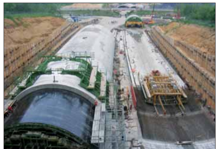
Obr. 6 Stavební jáma v prostoru komořanského portálu Fig. 6 The construction trench at the Komořany portal