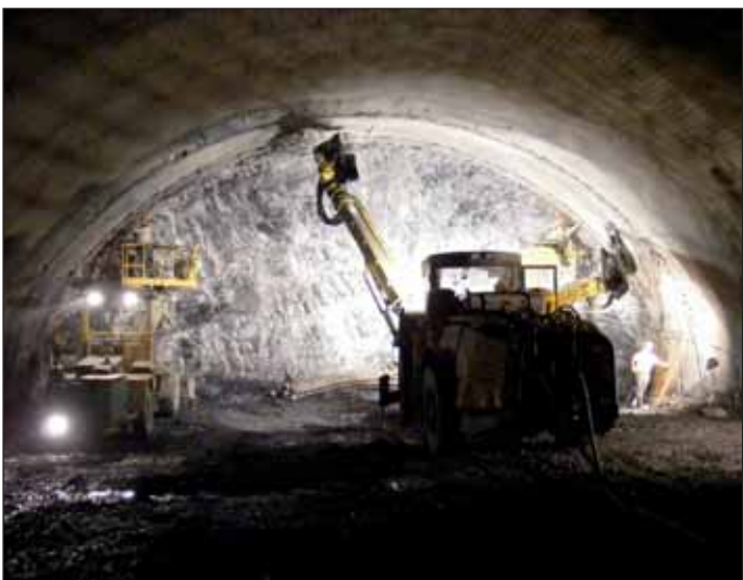
Obr. 9 Stavění tunelového rámu v odstavném zálivu dvoupruhového tunelu Fig. 9 Installation of a lattice girder in the double-lane tunnel lay-by