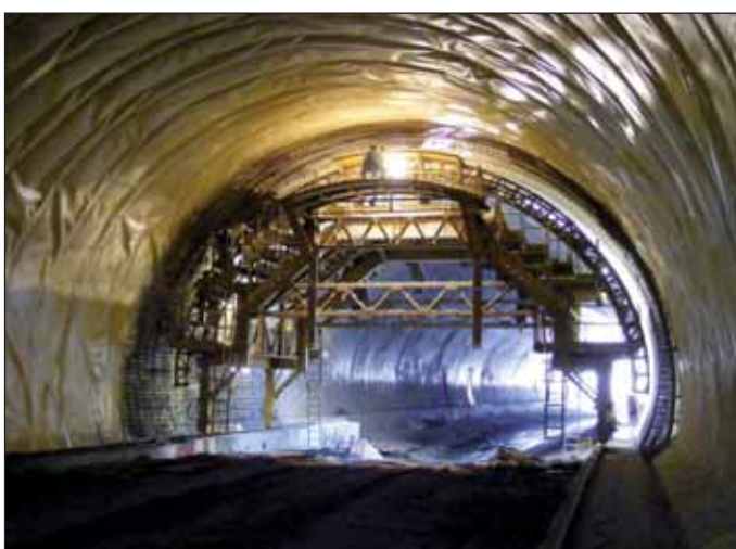
Obr. 12 Vázání výztuže prvního bloku definitivního ostění v třípruhovém tunelu Fig. 12 Tying-up the reinforcement of the first block of the final lining in the triple-lane tunnel