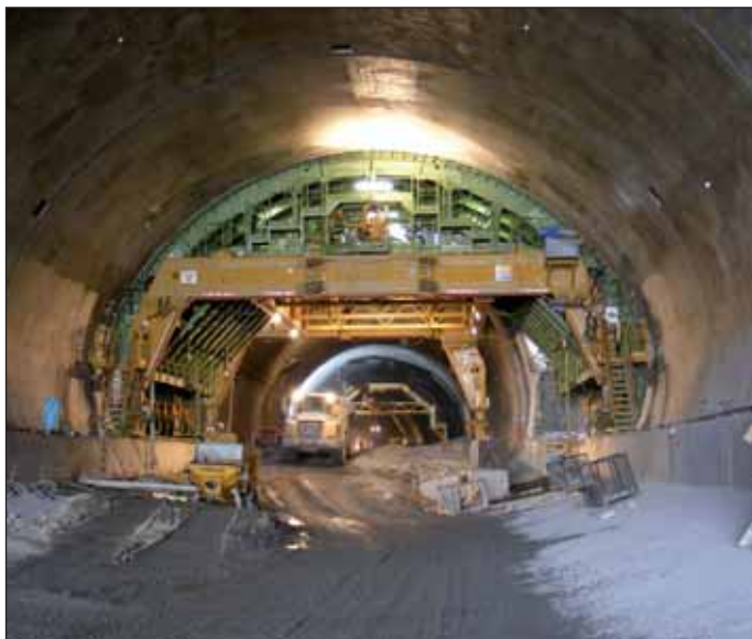
Obr. 7 Bednicí vůz na přechodu hloubeného čtyřpruhového a raženého třípruhového tunelu

Fig. 7 A travelling formwork at the transition between the cut-and-cover four-lane tunnel and the mined triple-lane tunnel