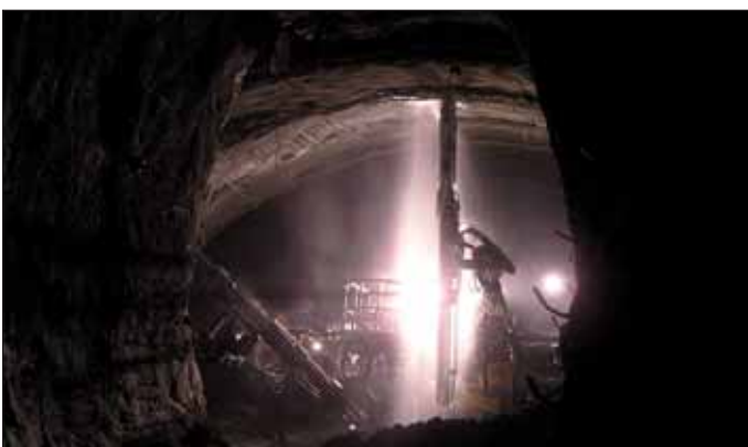
Obr. 5 Vrtání a osazování svorníků v třípruhovém tunelu Fig. 5 Drilling and installation of rock bolts in the triple-lane tunnel