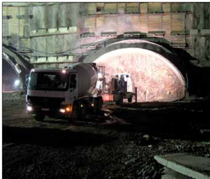
Obr. 8 Zahájení ražby dvoupruhového tunelu od cholupického portálu Fig. 8 Commencement of the driving of the double-lane tunnel from the Cholupice portal

Fig. 7 A travelling formwork at the transition between the cut-and-cover four-lane tunnel and the mined triple-lane tunnel