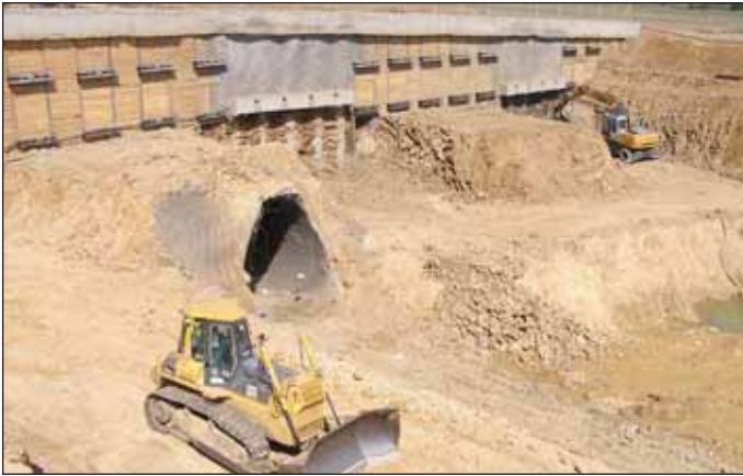
Obr. 1 Hloubení stavební jámy v prostoru cholupického portálu Fig. 1 Excavation of the construction trench at the Cholupice portal