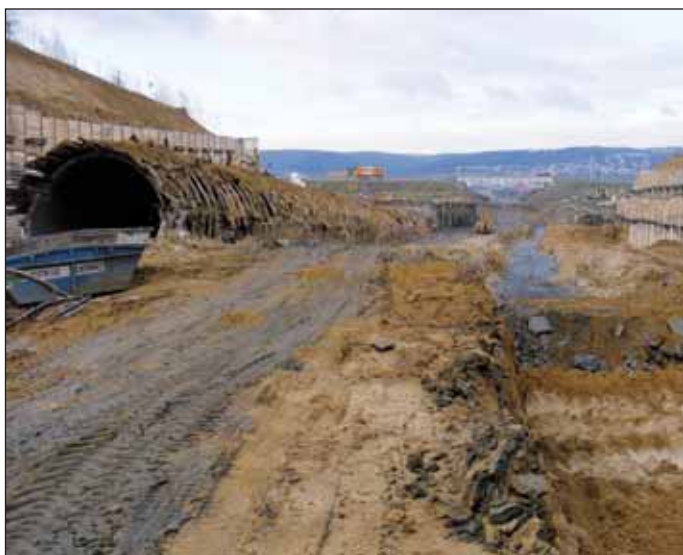
Obr. 11 Odhalená přístupová štola v komořanské stavební jámě Fig. 11 Exposed access adit in the Komořany construction trench