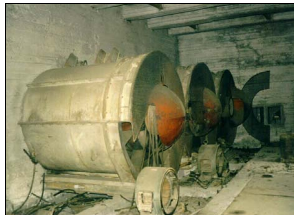
VENTILÁTORY NA JIŽNÍM PORTÁLU