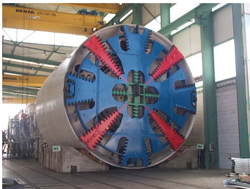
Obr.1 TBM použité pro ražbu tunelu ART

Vzhledem k velice nízkému nadloží tunelu vznikly vážné obavy ohledně kontroly sedání oblastí ovlivněné ražbou. Větší sedání by mohlo velmi vážně narušit chod letiště a teoretické finanční ztráty by mohly dosáhnout velmi vysokých hodnot. Proto byl vyvinut ojedinělý tunelovací stroj (TBM – Tunnel Boring Machine), jehož hlavním cílem bylo snížit veškerá rizika ražby na minimum (Obr.1).